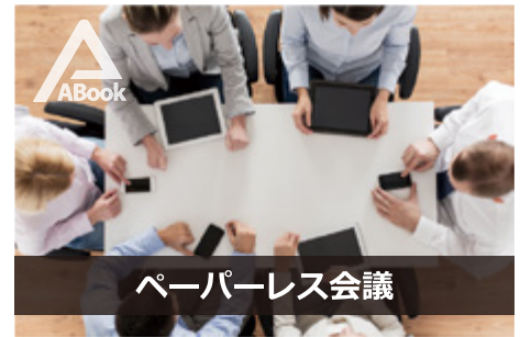
ペーパーレス会議

膨大な資料も安全に一括管理できます。共有設定や資料更新も各端末に即時に反映。必要な資料が最新の状態で共有されます。検索も容易なため業務効率が改善します。