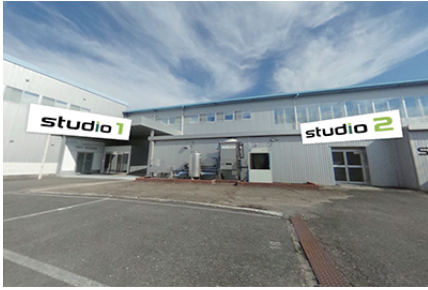
factor4 tech-studios バーチャル見学コース

松井製作所が掲げているミッション「成形工場の factor4 を実現する ※ 」を進める上での重要な要素のひとつが、次世代型体験施設「factor4 tech-studios（以下、テックスタジオ）」だ。